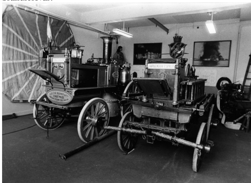
Ångspruta och hästfordon i Brandmuseet Lundby Brandstation 1984

Göteborgarna kunde inte missa att de hade ett effektivt brandförsvär!