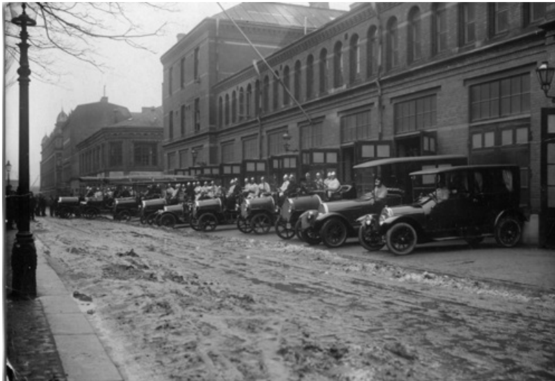
Den helt motoriserade vagnparken utanför Huvudstationen 1920

Först i augusti 1919 blev kåren helt automobiliserad.