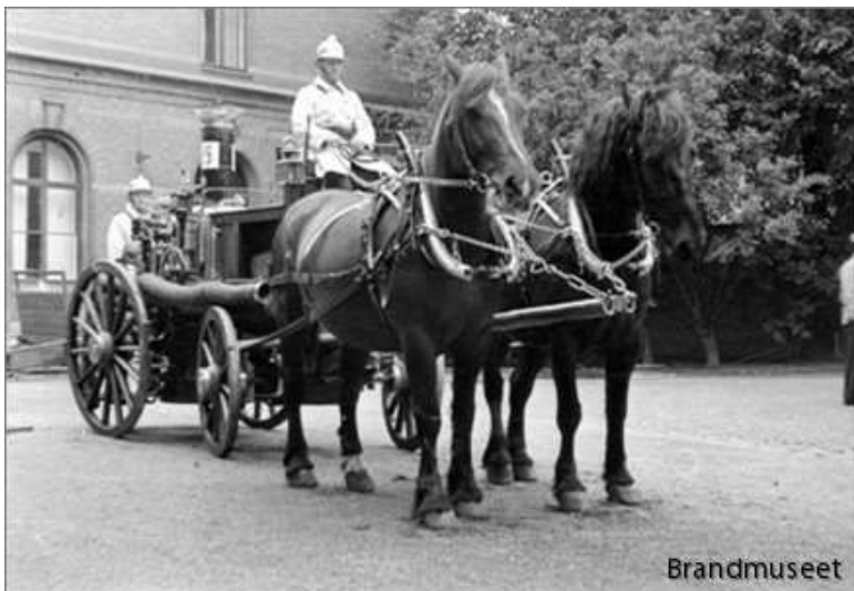
Hästar och ångspruta på huvudstationens gård.

fästas och därefter linorna spänns. När det var klart hade stationsvakten hunnit öppna dörrarna mot gatan och befäl och manskap fanns redan på vagnarna. Vid stort larm deltog 21 man i första utryckningen. Var det larm från brandskåp åkte vi med en redskapsvagn, en ångspruta och en stegvagn. Utryckningarna gick alltid i full karriär genom gatorna och aldrig annat än i galopp. Det tröttade de inkörda hästarna mindre än trav och dessutom kunde kusken stödja bättre med tömmarna i galopp, berättade Skoog som hade mer än 20 års erfarenhet som brandkusk. Utryckningssignalerna för att få fri väg bestod på den tiden i att man blåste i mässingshorn och klämtade i klockor.