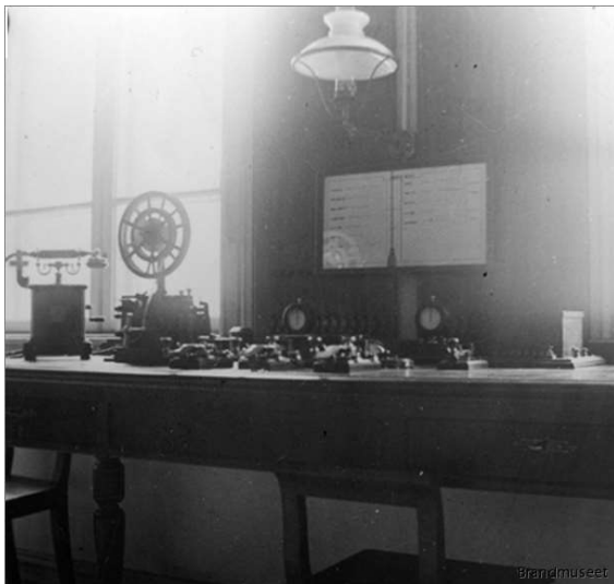
Telegrafbord med telefon och morseapparat.

Till brandkårens telegrafrum blev man av telefonisterna kopplade efter namnanropet "brandkåren" när man per telefon ville alarmera. Tornväktarna drogs in 1898, när brandskåp för alarmering samt telefoner blivit mera vanligt förekommande i centrala staden.