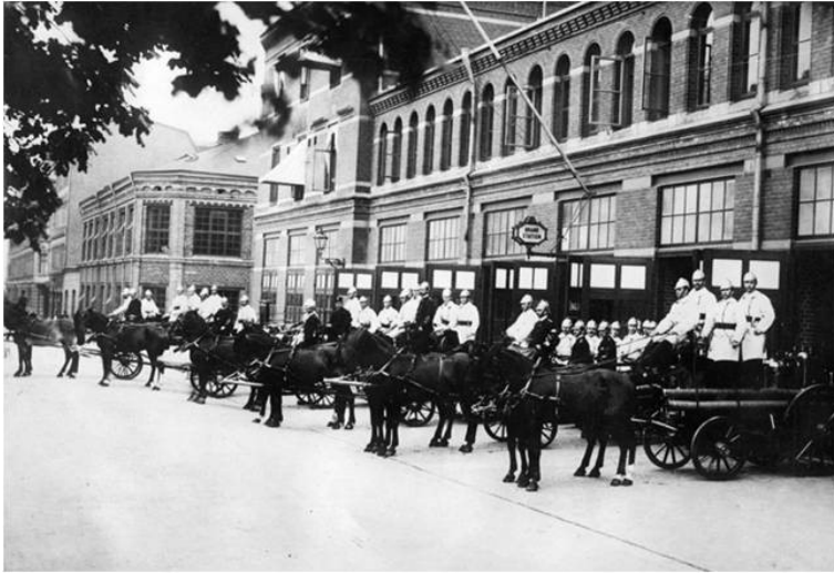
Huvudstationen i början av 1900-talet.

Till brandkårens telegrafrum blev man av telefonisterna kopplade efter namnanropet "brandkåren" när man per telefon ville alarmera. Tornväktarna drogs in 1898, när brandskåp för alarmering samt telefoner blivit mera vanligt förekommande i centrala staden.