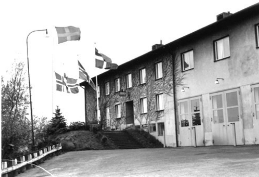
Lundby brandstation vid Nordiska Brandmästerskapen 1957

BIF var även representerade i Kungsbackaloppet samt i Vikingens och Kamraternas terränglöpningar.