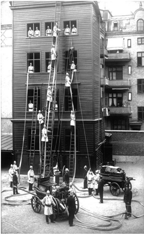
Övningstornet på Huvudstationen vid slutet av 1890-talet