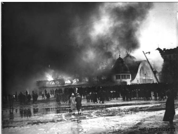
Branden i Göteborgs konserthus 13 januari 1928.

För första gången fick jag på nära håll tillsammans med brandbefäl och brandmän, som tog hand om mig vid brandsprutor och resta mekaniska stegar, följa släckningsarbetet.