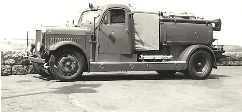
Bil 4 som skumbil 1959

Palle har med ramnumret på bilen letat i Scantias arkiv och tagit fram kopior på alla handlingar om bilen. En mapp med dessa papper skickar han till ägaren i Ale och en likadan mapp till mig, med ägarens namn och telefonnummer.