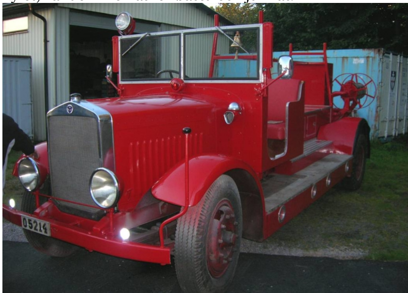
Bil 4 vid besök 2010

Mycket glada och jag lite skuldmedveten över priset på kyllet, vände vi hemåt för bastu och julmat.